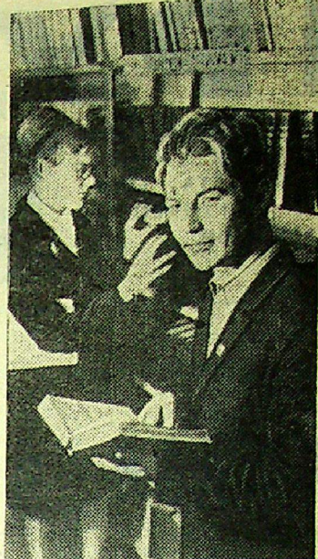
Оренбургская область. Тысячи сельских пропагандистов и политинформаторов ведут занятия в системе политпросвещения.

Соревнуясь за достойную встречу Ленинского юбилея, советские ракетчики и артиллеристы упорно борются за высокую культуру артиллерийско-стрелкового мастерства и ракетно-технической подготовки, учатся военному делу настоящим образом, так, как завещал В. И. Ленин. Они всегда в боевой готовности, на страже завоеваний социализма, мирного труда своего народа и народов братских стран.