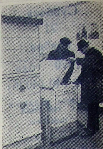
МОСКВА. на Всесоюзном смотре пчеловодного инвентаря и оборудования, который проходит сейчас на ВДНХ СССР, демонстрируется свыше 160 экспонатов, представленных научно-исследовательскими учреждениями, заводами, конструкторскими бюро, колхозами, совхозами, мастерскими и пчеловодами-рационализаторами.