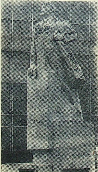
Москва. Народный художник СССР Л. Кербель закончил работу над гипсовой моделью памятника В. И. Ленину. Высота модели, как и будущего памятника, — 10,5 метра. Выполненный в граните, памятник будет установлен в центре Софии.

Собравшихся приветствовали пионеры Совхозной средней школы. Гости с абразивного завода дали концерт.