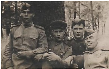
На фото: второй слева.

ЗАВОЛЖЬЕ. СТАРШИЙ ЛАБОРАТОРИСТ. СЕРЖАНТ. 1906 Г. – 2000 Г.