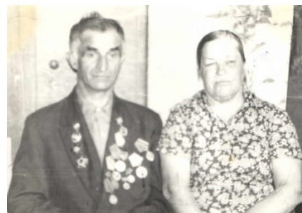
На фото: с супругой.

За боевые заслуги перед Родиной был награждён орденом Красной Звезды, орденом Славы III степени, орденом Отечественной войны II степени, медалями «За отвагу», «За боевые заслуги», «За победу над Германией в Великой Отечественной войне 1941–1945 гг.», юбилейными медалями.