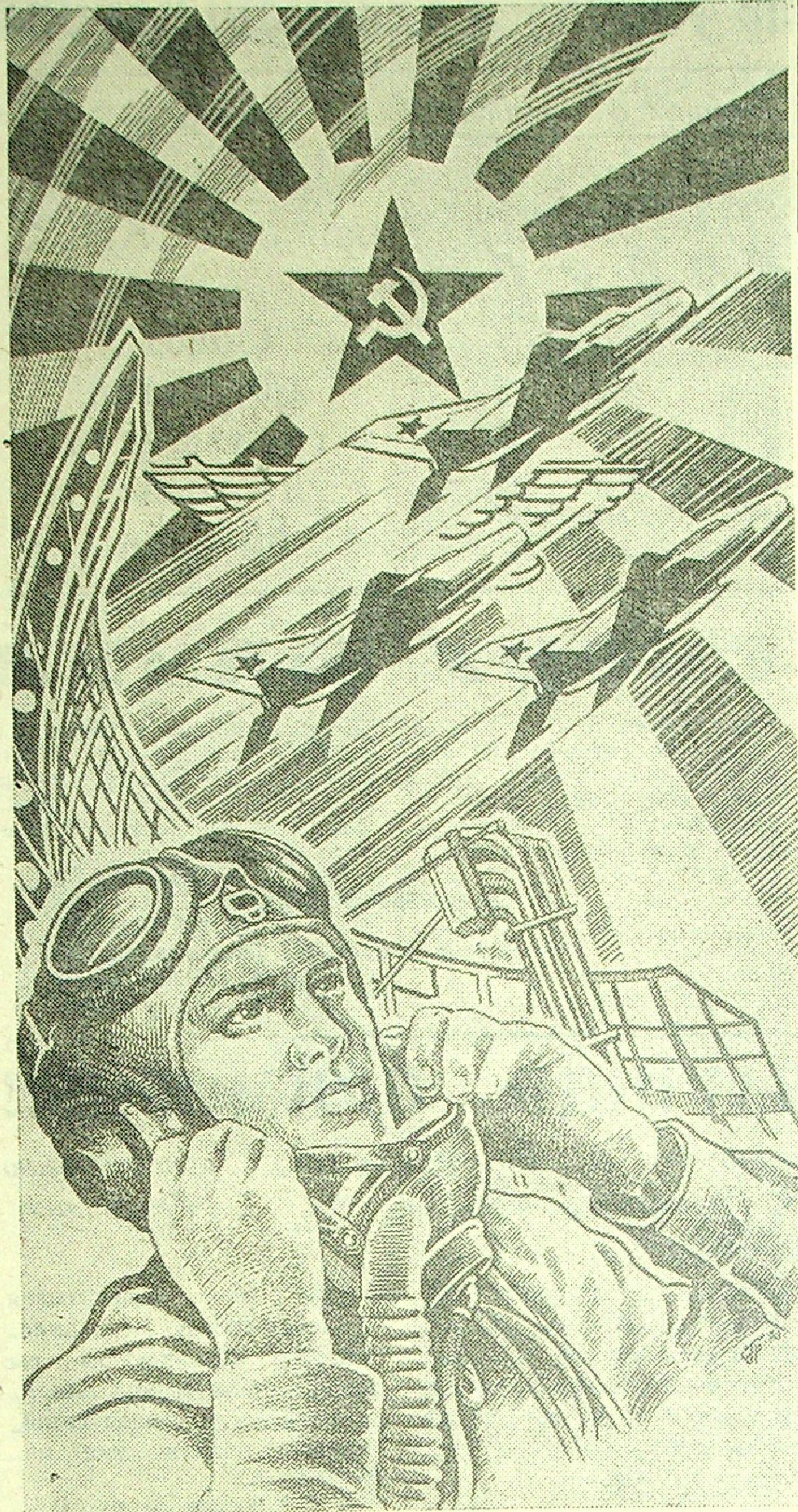
На страже мирного неба. Рисунок художника С. Андреева.