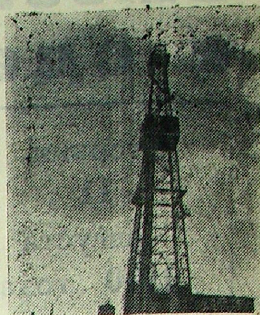
СТАВРОПОЛЬСКИЙ КРАЙ. С каждым годом расширяются границы нефтеносного района степного края. Начаты работы на новой разведочной площадке «Союзная».

Рекомендовано колхозам установить аналогичные условия материального обеспечения для лиц, направленных на повышение квалификации из колхозов.