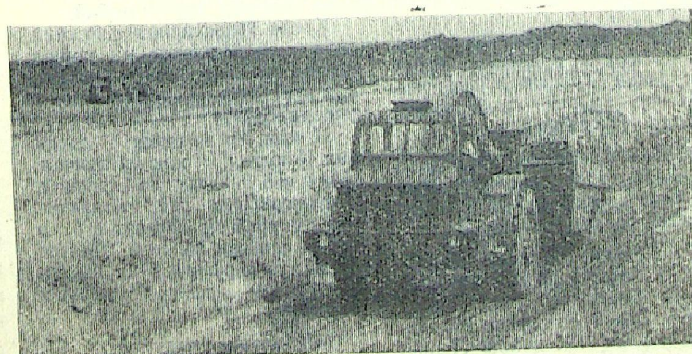
Каток идет по дну будущего канала.