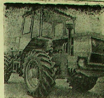
ЧЕХОСЛОВАКИЯ. Новый трактор - тягач — «Т-180» производства Либерецкого автозавода.

Более двадцати процентов всей выпускаемой чехословацкими предприятиями сельскохозяйственной техники поставляется в Советский Союз.