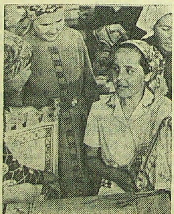
ЧУВАШСКАЯ АССР. Более чем в 50 стран поступает продукция Альгешевской фабрики художественной вышивки.