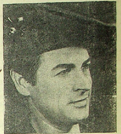
ПНР. Станислав Минульский

— популярный польский актер Он хорошо известен советским телезрителям по многосерийному фильму «Ставка больше, чем жизнь», в котором исполняет роль капитана Клоаса.