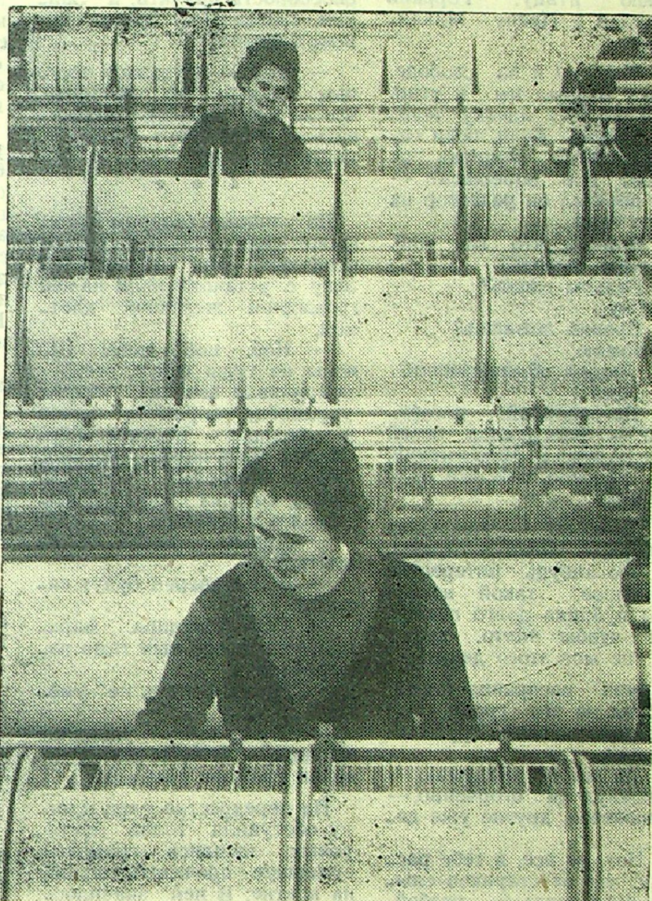
14 ИЮНЯ — ДЕНЬ РАБОТНИКОВ ЛЕГКОЙ ПРОМЫШЛЕННОСТИ

Сам я, малограмотный человек, удостоился высокой чести — на протяжении нескольких лет был председателем совхоза, затем мне доверили и другие руководящие посты. Сейчас я — бригадир полеводческой бригады. С 1940 года — член партии. Как видите, Советская власть дала мне очень много, так много, что всего и не перечислишь.