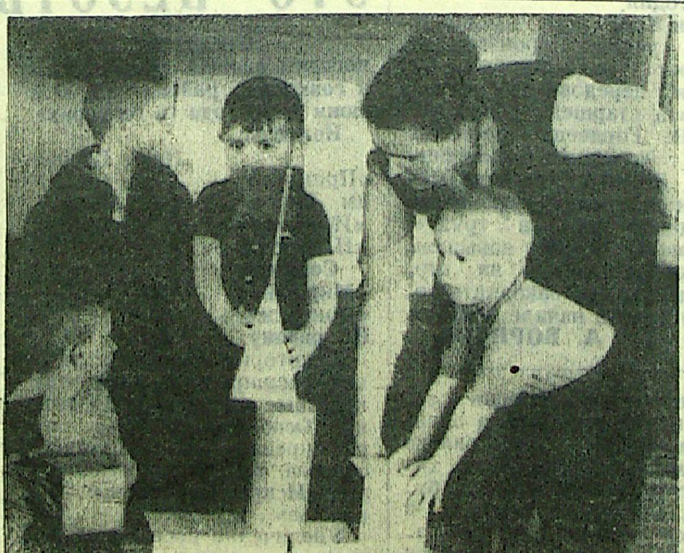
На снимке: в детсаде-яслях колхоза «Приморье».

Большие возможности открываются перед работниками просветительского фронта в связи с вводом в эксплуатацию новой восьмилетней школы на территории колхоза «Приморье». Строительство этой школы начинается в нынешнем году.