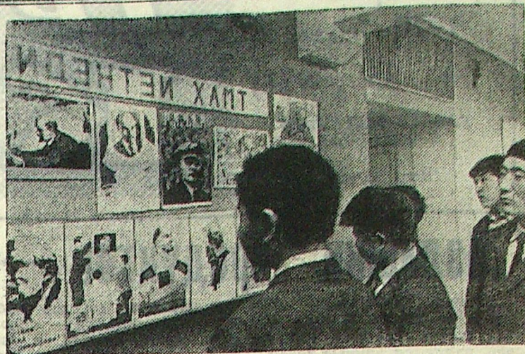
МНР. Недавно в небольшом городке Байнчандмань открылось профессионально-техническое училище, которое готовят специалистов для сельского хозяйства страны. Здание училища построено с помощью СССР и оборудовано всем необходимым для теоретических и практических занятий. Училище ежегодно будет выпускать 600 специалистов для села. На снимке: один из стендов выставки, посвященной 100-летию со дня рождения В. И. Ленина, которая открыта в актовом зале училища.