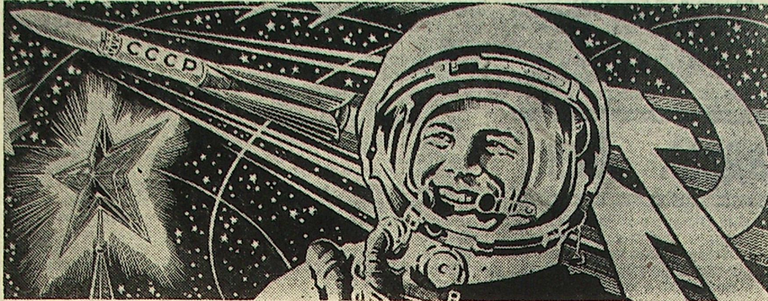
Рисунок художника С. Гринько.