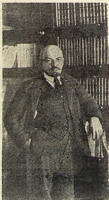
В. И. Ленин у книжного шкафа в своем кабинете в Кремле. Москва, 16 октября 1918 года.