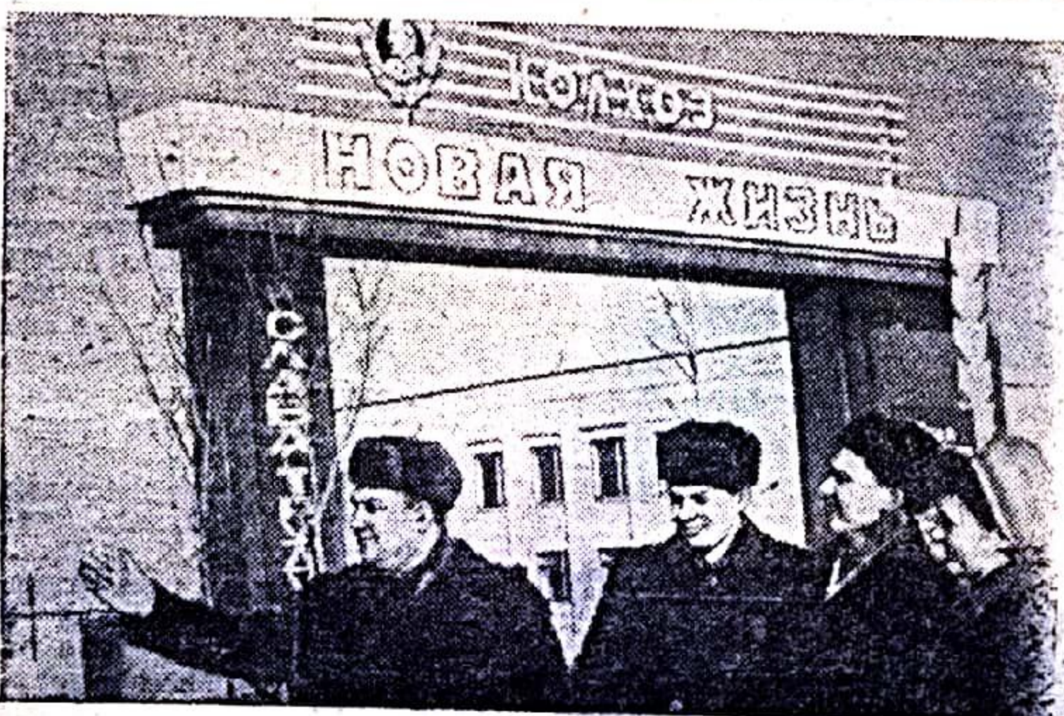
Ордена Ленина колхоз «Новая жизнь» (Шекнинский район) — один из передовых в Тульской области. Переинимать опыт в колхоз приезжают много делегаций из разных областей страны.