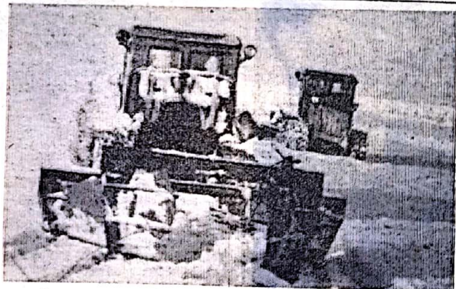
Высокими темпами ведут снегозадержание механизаторы первого отделения совхоза «Приволжье».

Исполком районного Совета депутатов трудящихся обязал руководителей организаций, учреждений и хозяйств улучшить работу, добиться искоренения недостатков и ликвидации причин, порождающих жалобы трудящихся.