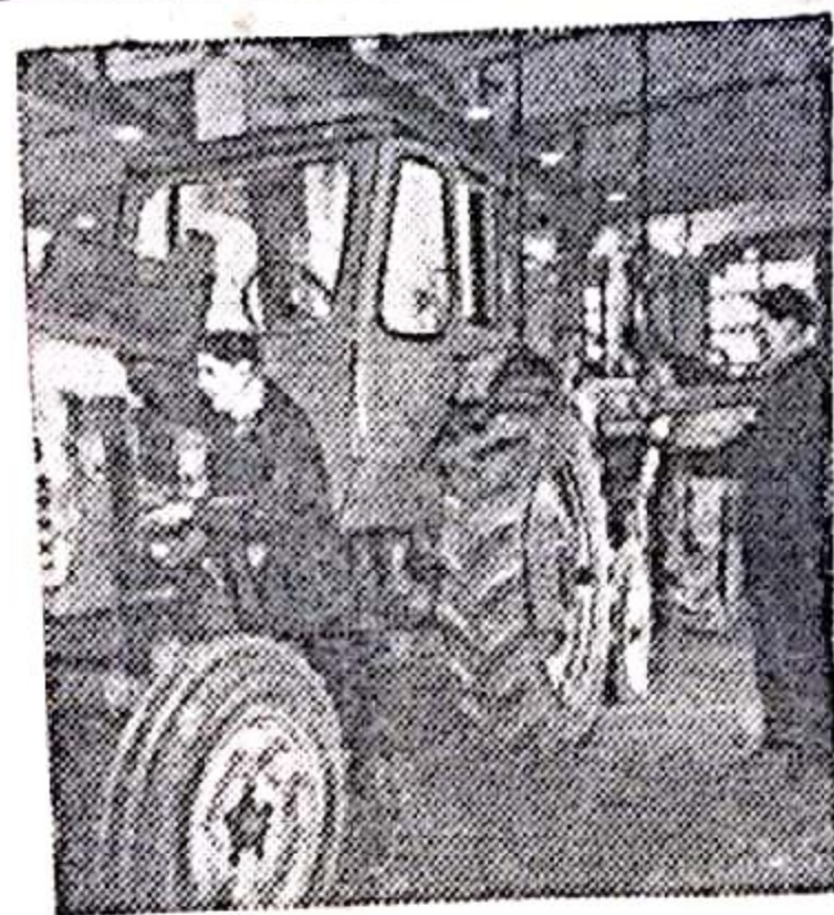
Брянская область. Успешно ремонтируют технику в Брянском районном объединении «Сельхозтехника».

Труженики области единодушно одобряют программу по широкому развитию орошения земель в Поволжье и выражают глубокую благодарность партии и правительству за заботу о дальнейшем подъеме сельского хозяйства в нашей засушливой зоне.