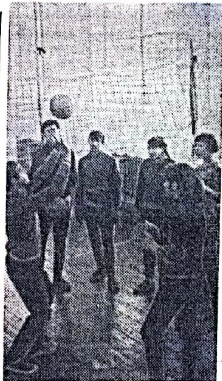
БАШКИРСКАЯ АССР. Колхоз имени Салавата Стерлитамакского района на свои средства построил новую школу. В ней хорошо оборудованы актовый и спортивный залы, предметные кабинеты и учебные классы.

И. УБОВ, заведующий Нижне-Печерским медпунктом.