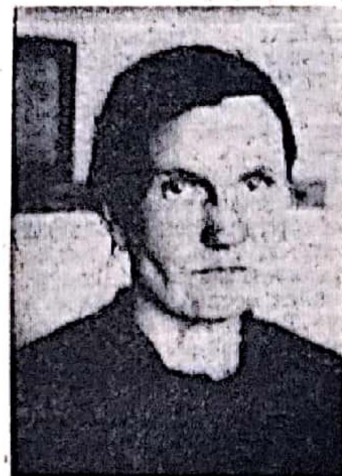
— До девяти килограммов молока получаю я от каждой фуражной коровы за день. Это не предел. Буду работать лучше.

Зимовка в разгаре. Проходит она благополучно. Об этом можно судить по тому количеству молока, которое ежедневно отправляем государству. Многие наши доярки получают в настоящее время значительно больше молока, чем в эти же дни прошлого года.