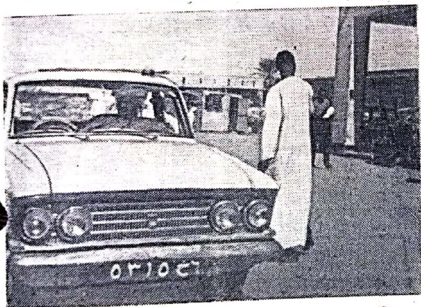
«Москвич-408» — эту небольшую, неприхотливую и экономичную машину можно увидеть в любом городе Судана. На снимке: «Москвич-408» на одной из улиц Хартума.