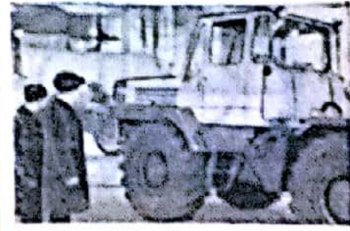
МОСКВА. Окколо 400 различных сельскохозяйственных машин демонстрируются на выставке «Ленинский кооперативный план в действии» на ВДНХ СССР.