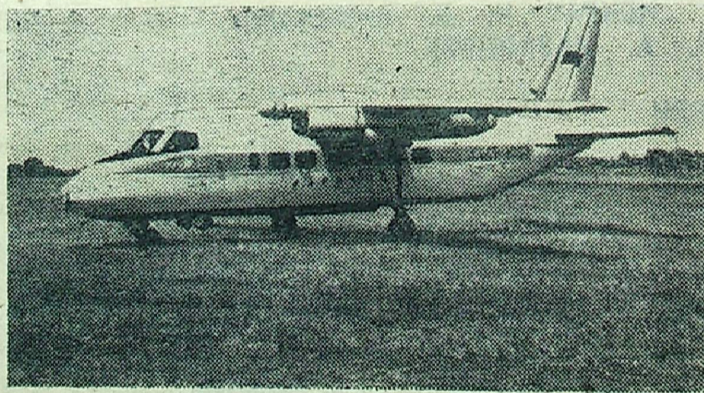
На зеленом поле стоит готовый к взлету новый самолет (на снимке). Создан он в конструкторском бюро под руководством