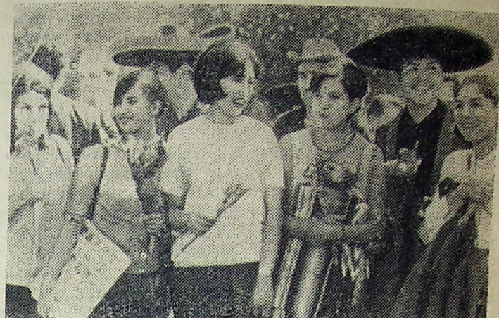
На снимках: 1. Советская делегация в столице Болгарии. Встреча давних друзей. 2. Участники фестиваля во время торжественного шествия по улицам столицы Болгарии. 3. Посланцы молодежи стран Латинской Америки в столице фестиваля.