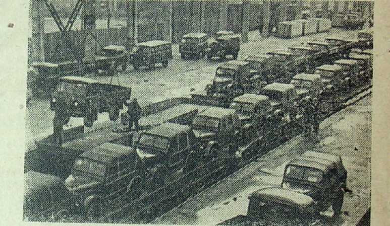
УЛЬЯНОВСК. Самая популярная легковая автомашинка — ульяновский газик. Благодаря этому вездеходу в колхозах и совхозах даже в распутицу и непогоду можно выезжать на самые отдаленные участки. На Ульяновском автомобильном заводе строго контролируется выполнение плана реализации автомашин для сельского хозяйства. Коллектив из месяца в месяц опережает график отгруз-