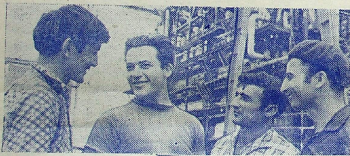
Азербайджанская ССР. Поставлен под промышленную нагрузку седьмой блок Али-Байрамлинской ГРЭС. С вводом его в эксплуатацию завершилось строительство энергетического гиганта на Куре.

В сооружении ГРЭС приняли участие строители и монтажники из многих республик Советского Союза. Оборудование поставляли предприятия Москвы, Ленинграда, Харькова, Таганрога и других городов.