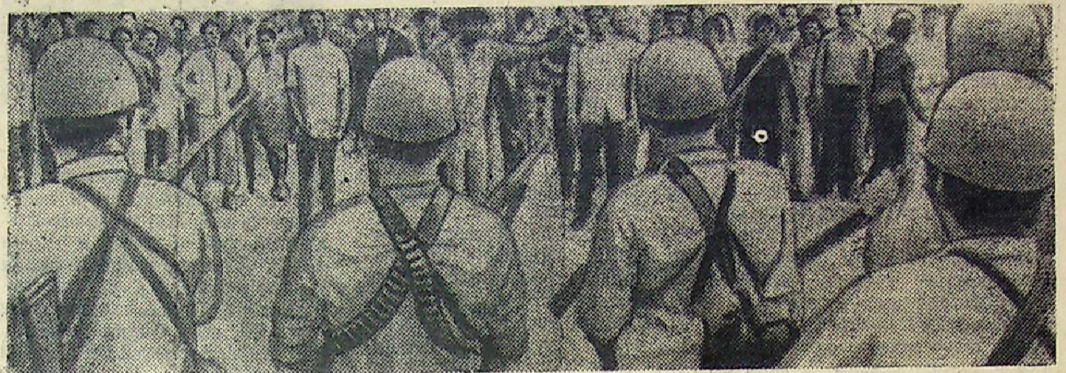
В Соединенных Штатах продолжаются выступления негров против дискриминации негритянского населения страны.

На снимке: полиция готовится разогнать демонстрацию негритянского населения в Новом Орлеане.