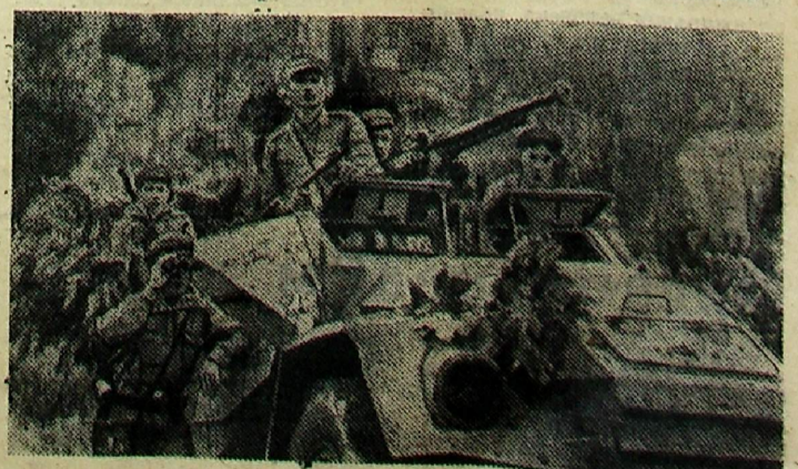
Отряды Патристических вооруженных сил Лаоса, действующие в провинции Аттоне, за последние три месяца вывели из строя около 800 солдат противника и захватили большое количество вооружения.

На снимке: лаосские патристы в боевом дозоре.