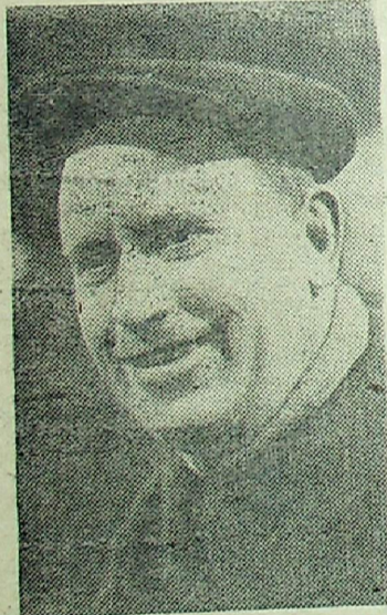
Многие смены и бригады Липецкого тракторного завода имени XXIII съезда КПСС соревнуются за право участвовать в сборке 500-тысячного трактора. Это торжественное событие состоится в декабре.

За годы пятилетки здесь резко увеличился выпуск тракторов для сельского хозяйства, возросла производительность труда.