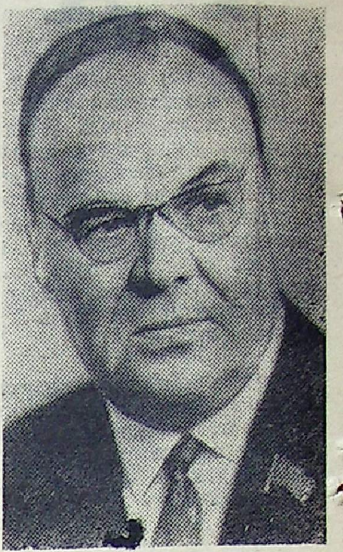
10 декабря исполняется 70 лет со дня рождения известного советского скульптора Николая Васильевича Томского, автора проникнутых гражданственной героикой памятников С. М. Кирову в Ленинграде, И. Д. Чернышевскому в Вильносе, П. С. Нахимову в Севастополе, Н. В. Гоголю и М. В. Ломоносову в Москве, В. И. Ленину в Орле, Ворошилова, Куйбышева, Саранске.