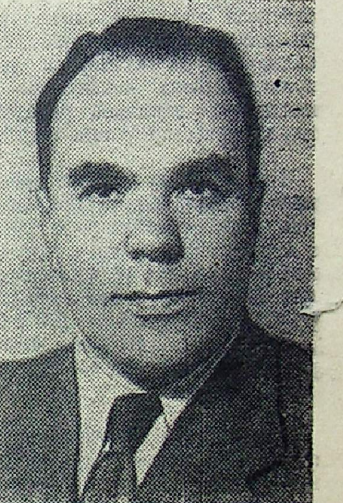
21 декабря исполняется 70 лет со дня рождения советского драматурга Всеволода Вишневского (1900—1951). В золотой фонд вошла его лучшие пьесы «Первая Конная», «Оптимистическая трагедия», «Последний решительный».