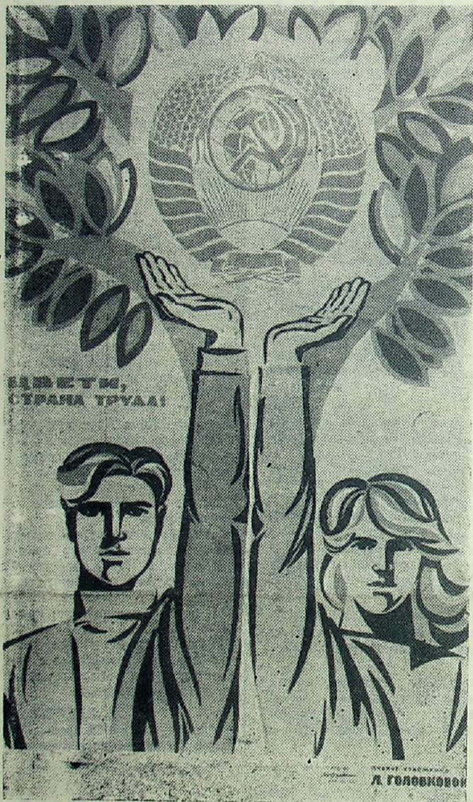
Плакат художника Л. Головковой (издательство «Изобразительное искусство»).