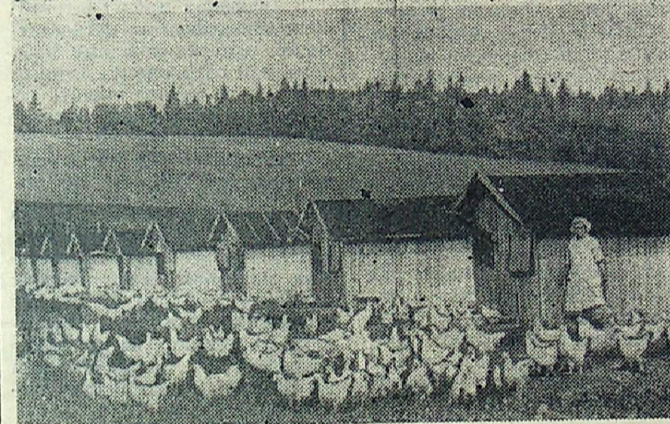
«Важное значение для дальнейшего подъема животноводства имеет широкое внедрение производства продукции на промышленной основе. Опыт показывает высокую эффективность такой организации производства».

(Из доклада тов. Л. И. Брежнева на июльском Пленуме ЦК КПСС)